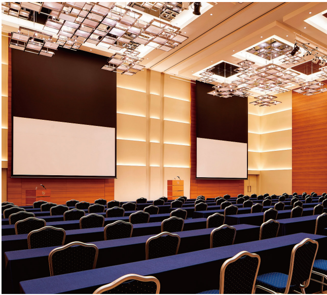
美波(全) 338㎡ 美波(A) 150㎡ 美波(B) 150㎡